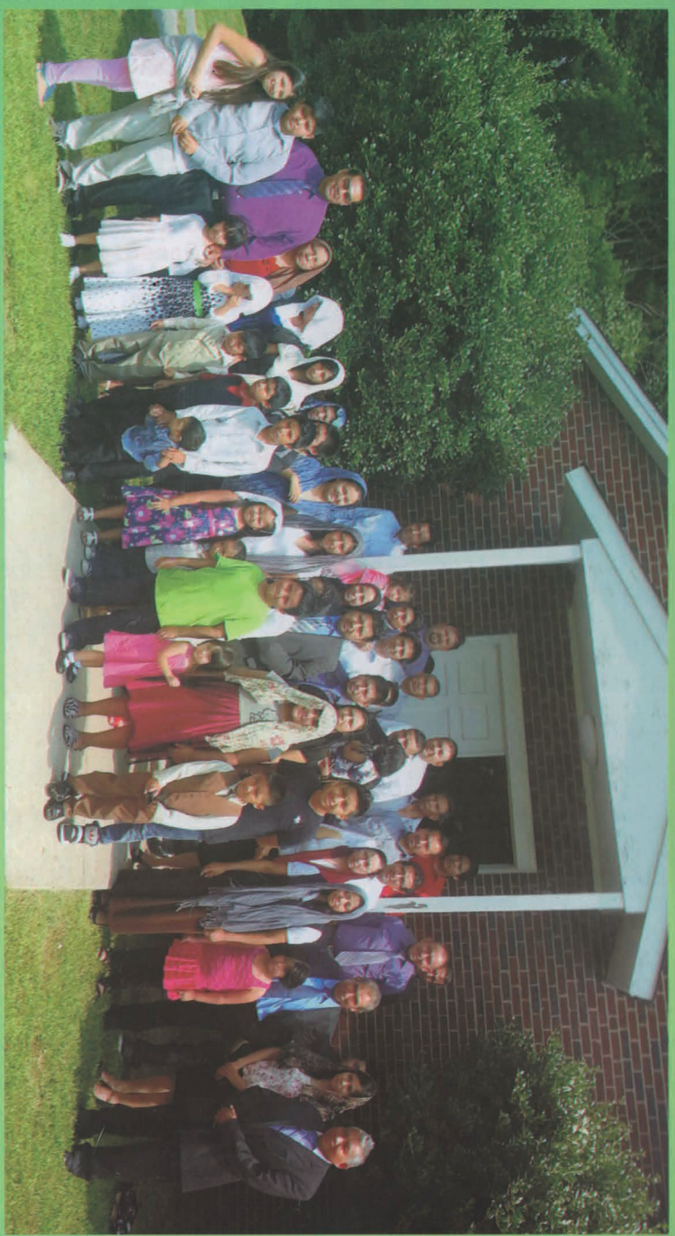
Congregación de Greensboro, N-C. Estados Unidos de Norteamérica